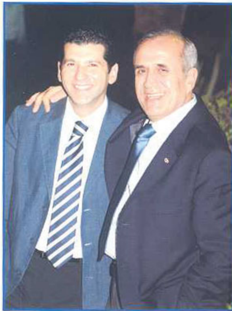
«Le Président est mon père, mon frère et mon ami.»