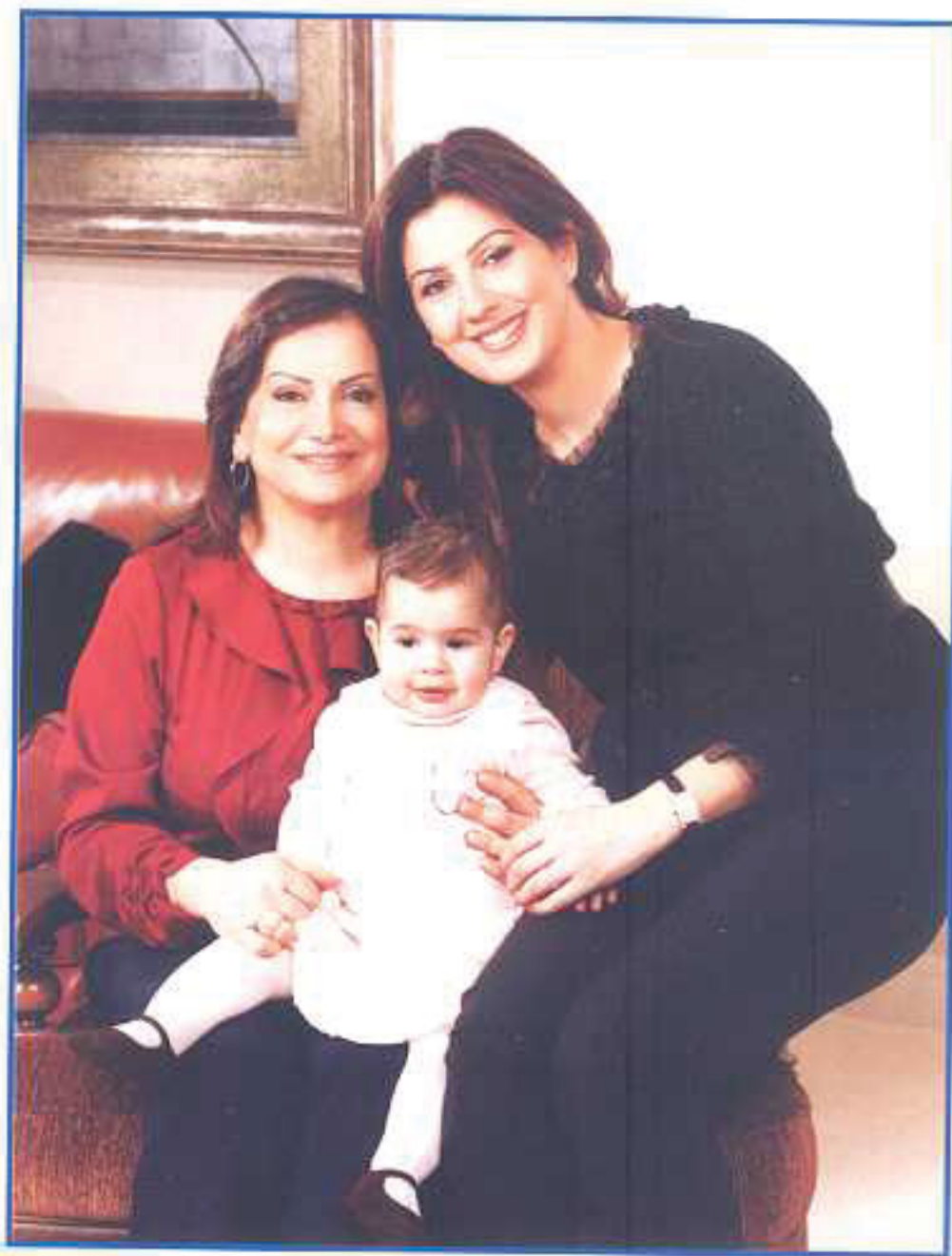
La mère, la fille et la petite-fille.