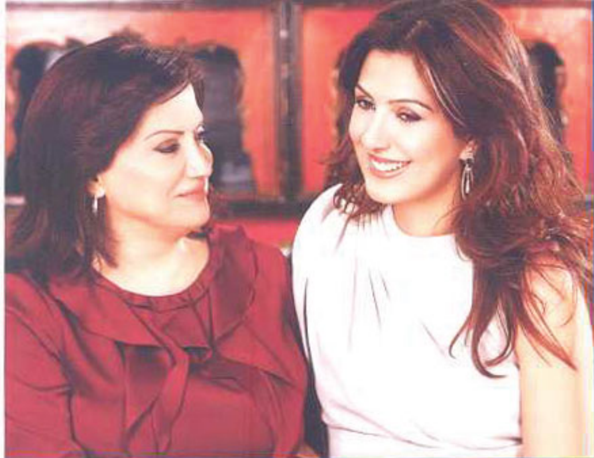
Complicité entre la mère et la fille.