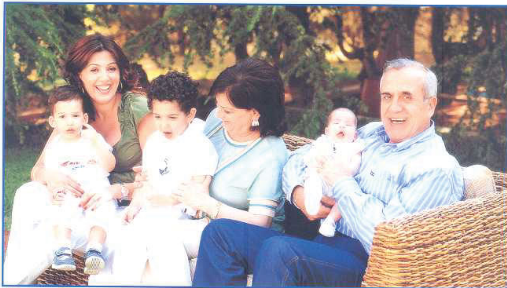
Dans les jardins du palais présidentiel, un moment de détente familiale.